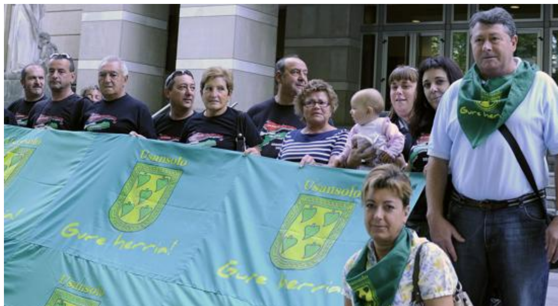
Miembros de la plataforma en el juzgado en 2012.